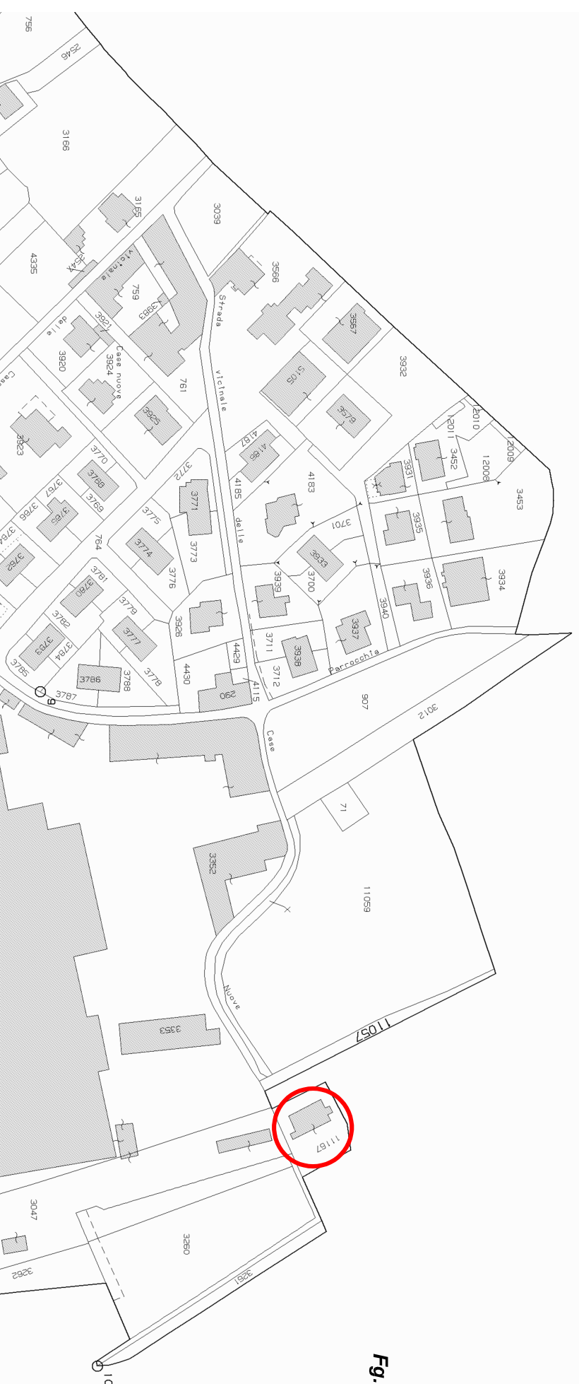
ESTRATTO MAPPA Fig. 13 - censuario di Toscolano scala 1:2000