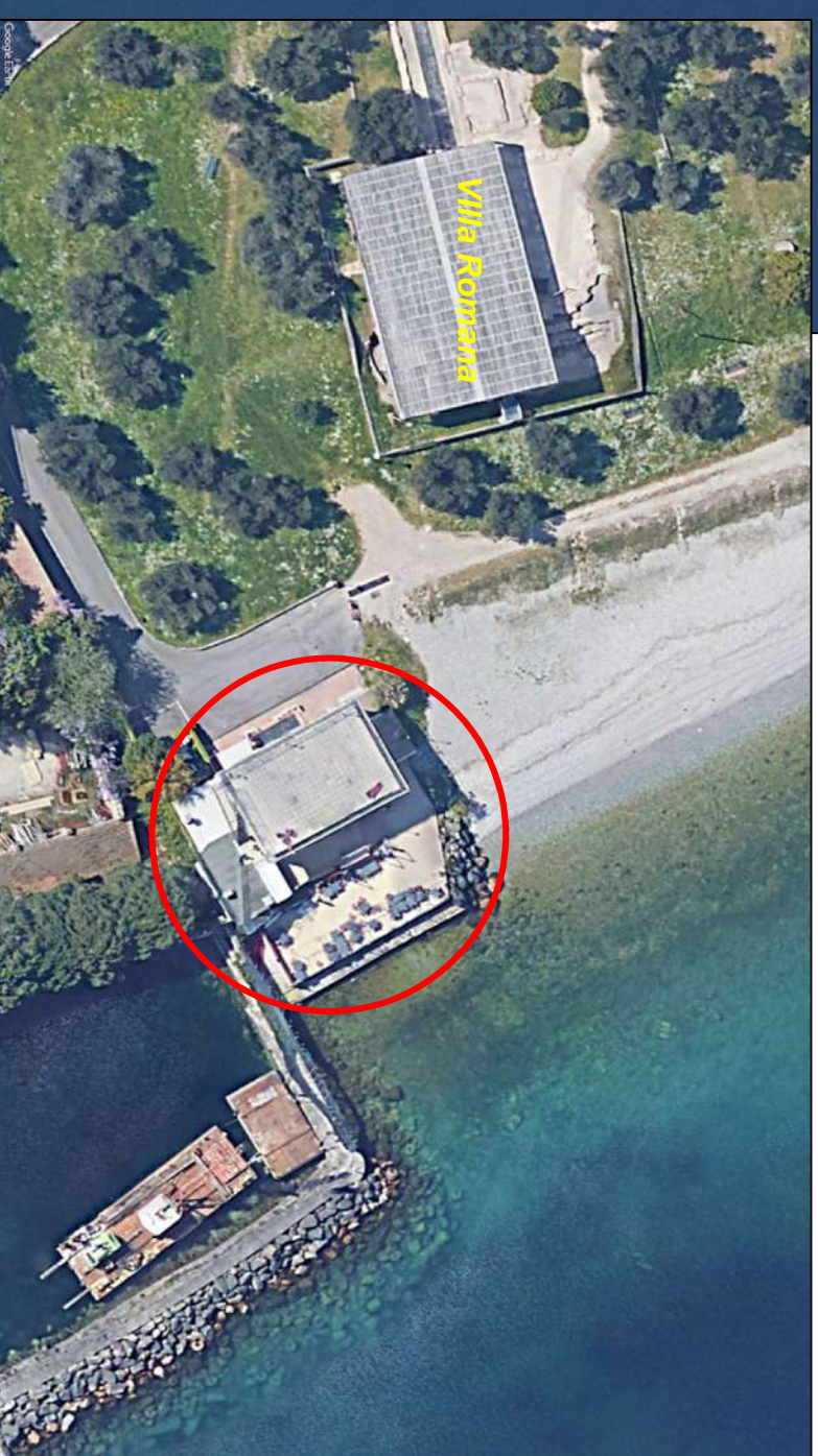
DETTAGLIO VISTA AEREA (fuori scala)